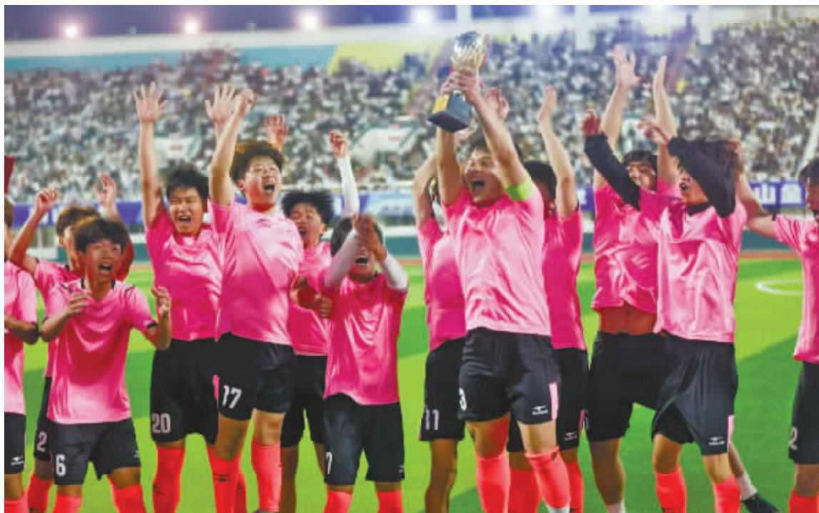
球场上的胜利一刻。