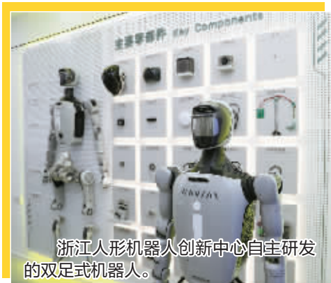
浙江人形机器人创新中心自主研发的双足式机器人。