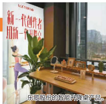
乐歌股份的智能升降桌产品。