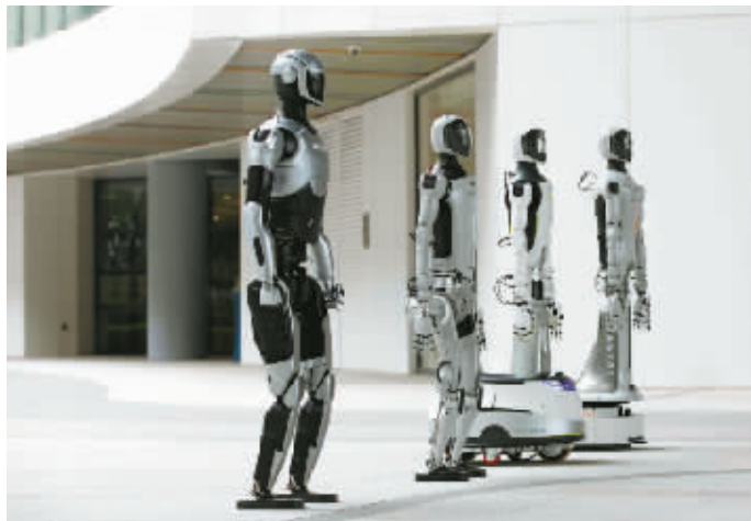
“浙江人形”的“领航者NAVIAI”机器人矩阵。

同时,公司还携手国家级电网,推动配电室人机协同巡检数字化变革。其产品还进驻欧洲家电领军品牌BEKO的土耳其生产基地,执行产品质检任务,成为国产自主人形机器人出海落地的先行者。