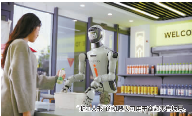
“浙江人形”的机器人可用于商超零售场景。