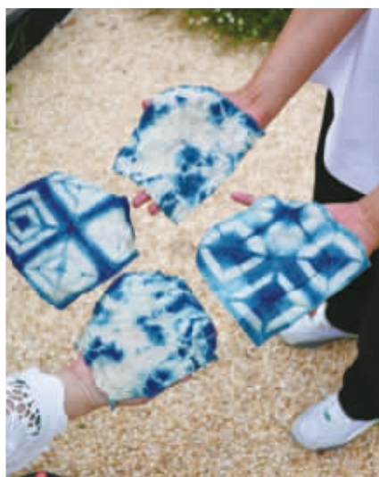
制作完成扎染手帕。