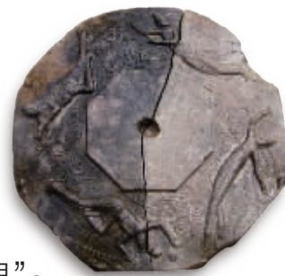
宋代经幢宝盖石构件。