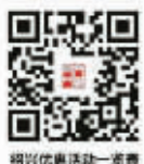
绍兴优惠景点一览表