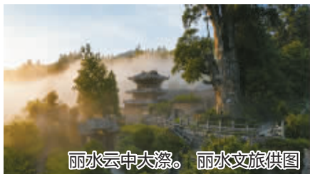
丽水云中大漈。