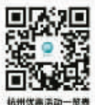
杭州优惠景点一览表