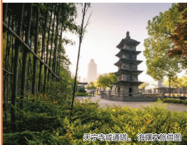
天宁寺咸通塔。