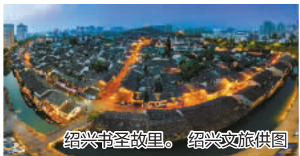
绍兴书圣故里。