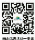
丽水优惠景点一览表