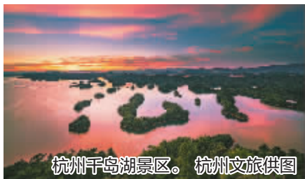
杭州千岛湖景区。