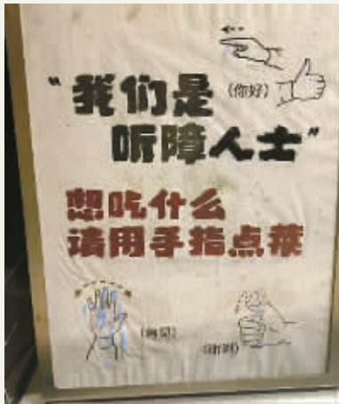
摊位旁的手语图案。