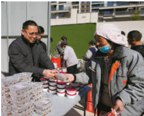
九龙湖镇爱心商家给建筑工人送当地特色小吃。