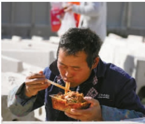
建筑工人吃得津津有味。