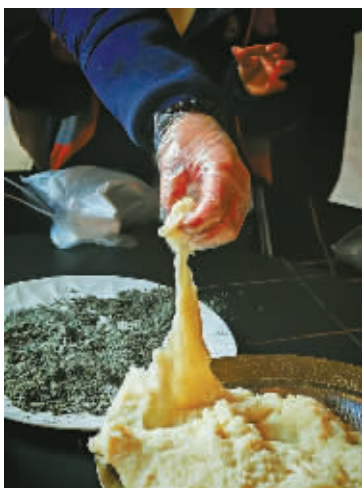
往年“年猪宴”活动场景。(资料图片)

谢界山村是宁波市历史文化名村，周围群山环抱，村里古建遗存丰富。作为大堰文旅与谢界山乡村运营师联合打造的特色品牌活动，谢界山年猪宴自2024年起已成功举办两届，本届为第三届。活动将联动镇内多村文旅资源，以更丰富的内容、更贴心的安排，为游客献上一场沉浸式、有温度的乡村年味盛宴。