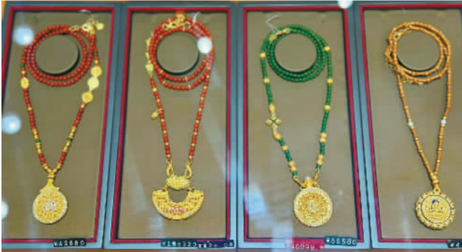
门店金饰产品展示。

临近农历年关，宁波黄金消费市场暗流涌动。社交平台上，“潮宏基1月15日涨价”的讨论热度未消，线下门店悄然进入“调价倒计时”。