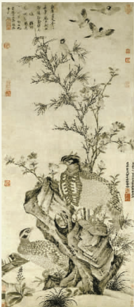
元代王渊《竹石集禽图》。

近期，关于明代仇英《江南春图》的消息引发持续关注。此画1959年由庞莱臣后人捐赠南京博物院后，1961年，当时文化部曾组织张珩、韩慎先、谢稚柳三位专家到南博进行鉴定，并给出专业意见。