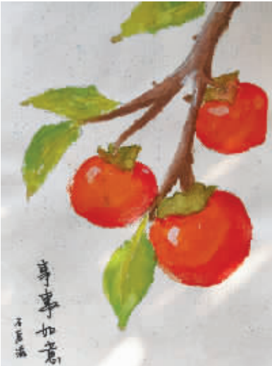
事事如意 镇海区实验小学308班 石辰滋(证号W26207867)指导老师:应豪