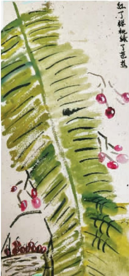
樱桃红了 鄞州区董山小学213班 刘思妤(证号W26108082)指导老师:马瀛莹

家,是藏着温柔与牵挂的港湾,每一处细碎光景都浸满爱意。它是灯下听来的童年跳房子趣事,是亲手包饺子尝出的苦后回甘,是外婆果园里四季不变的果香,是老家果园流转的四季美景,是故乡烟火缭绕的熟悉景致,更是小村庄里落日浸染的温柔。这些文字,字字句句都是心底对家最真挚的眷恋与热爱。