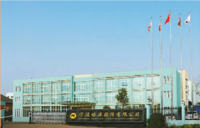
宁波培源股份有限公司外景。

培源股份主要客户为采埃孚、天纳克、蒂森克虏伯、安斯泰莫等全球知名的汽车零部件制造商以及比亚迪等整车厂商。2022年至2025年上半年,该公司前五大客户收入占当期营业收入比例分别为83.83%、81.53%、80.49%、77.83%。其中,2025年上半年,比亚迪为培源股份第三大客户,占销售总额的11.54%。 记者 张恒