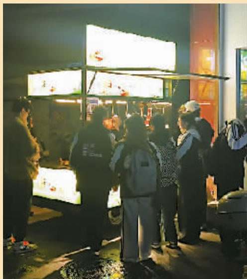
杨叔的夜宵摊,很多学生自发来捧场。视频截图