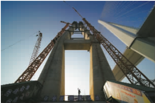
2025年1月13日,建设中的大桥。