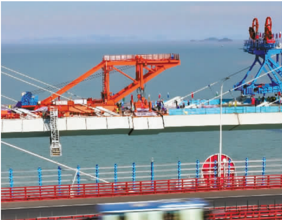
2025年12月29日下午15时15分,宁波市域铁路象山港跨海大桥顺利合龙。