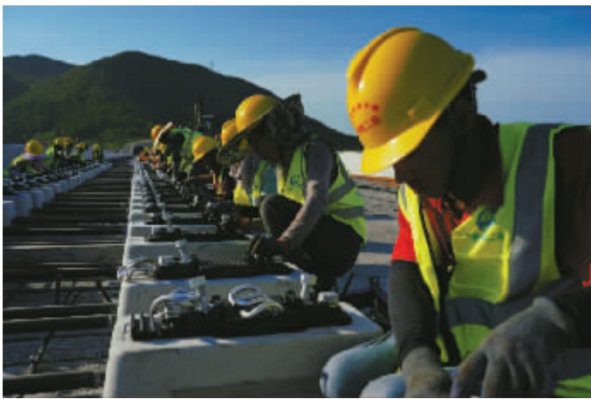
2025年9月8日,市域铁路象山段正在辅轨。