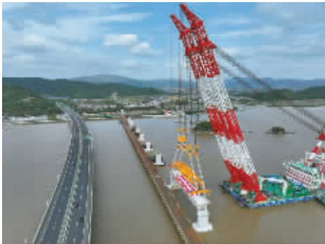
2024年11月5日,象山港跨海大桥首根60米预制箱梁成功架设。