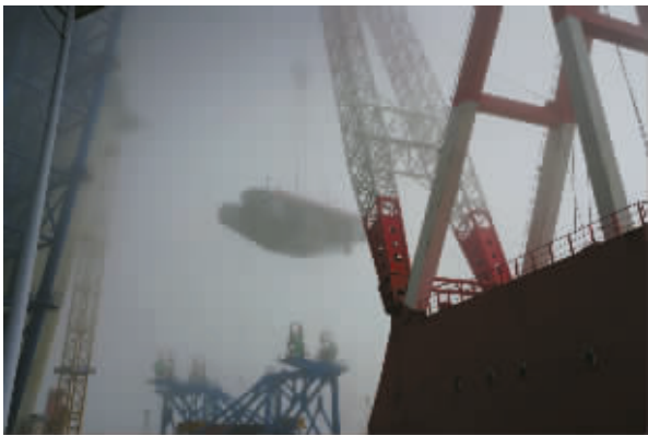
2025年5月22日,象山港跨海大桥69号主墩首节段钢箱梁架设成功。