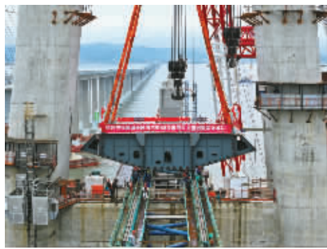
2025年4月27日,象山港跨海大桥68号主墩首节段钢箱梁架设成功。