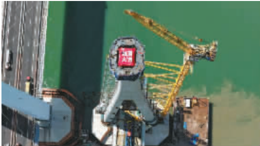
2025年6月16日,象山港跨海大桥两座主塔双双封顶,这标志着大桥全面进入主桥段钢箱梁架设阶段。