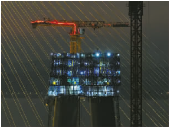
2025年1月2日,象山港跨海大桥主塔施工。

12月29日下午15时15分,随着最后一块钢箱梁精准吊装到位,国内首座市域(郊)铁路跨海大桥——宁波市域铁路象山港跨海大桥顺利合龙,为后续象山线按期通车奠定基础。这座全长8.276公里的“海上飞虹”,也是“国内紧邻既有桥最大跨径桥梁”“世界最大跨径无砟轨道铁路斜拉桥”,其技术难度之大、建设标准之高,在国内同类工程中有众多之最。从2023年开工到顺利合龙,历时1000余天,每一步都凝聚着建设者的心血与汗水。