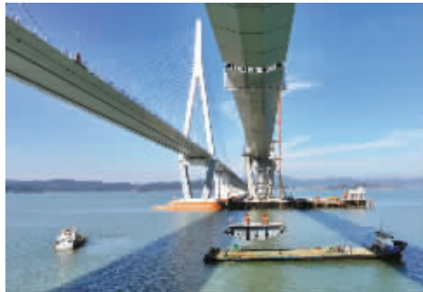
2025年12月29日下午,合龙段钢箱梁被缓缓提至空中,朝着桥面仅存的缺口平稳上升。