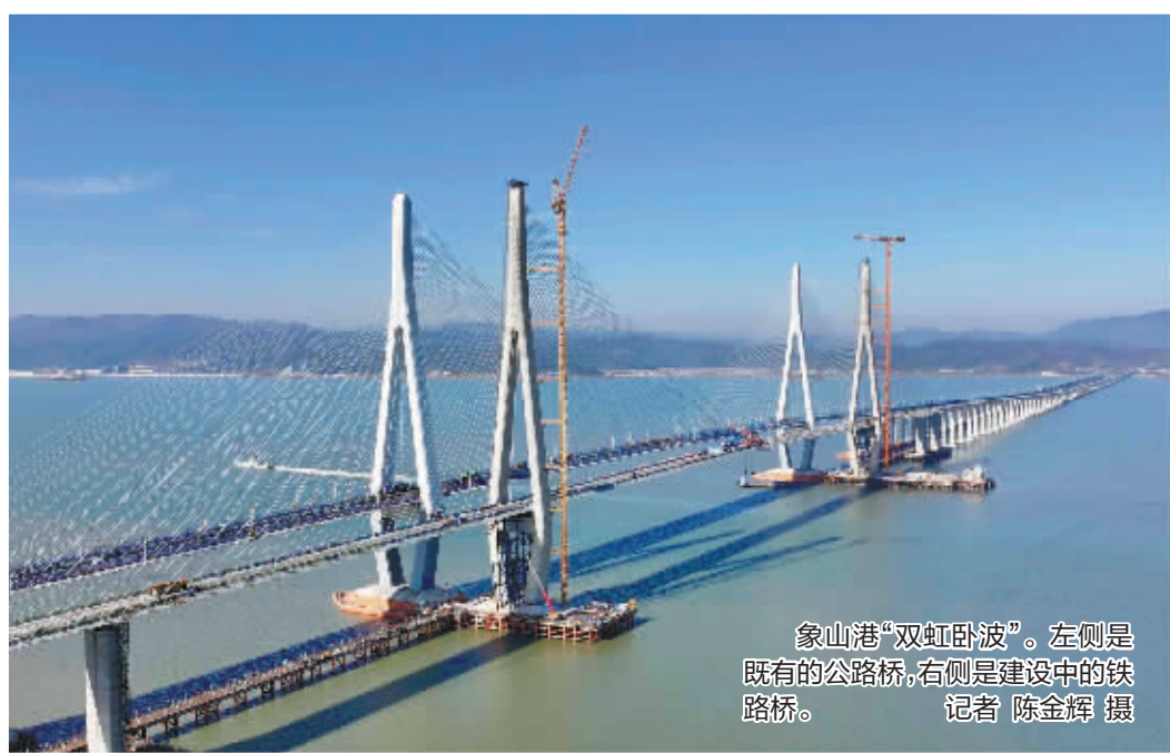
象山港“双虹卧波”。左侧是既有的公路桥，右侧是建设中的铁路桥。

12月29日 15:15，随着最后一片钢箱梁精准吊装到位，国内首座市域（郊）铁路跨海大桥——宁波市域铁路象山港跨海大桥顺利合龙。该桥全长8.276公里，是国内紧邻既有桥最大跨径桥梁，也是世界上最大跨径无砟轨道铁路斜拉桥。