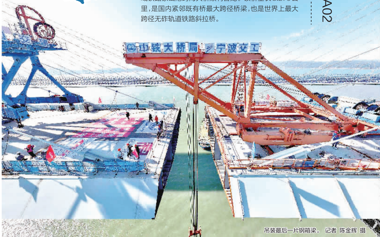
吊装最后一片钢箱梁。