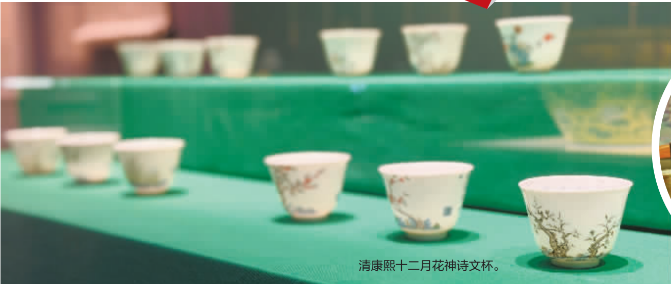
清康熙十二月花神诗文杯。