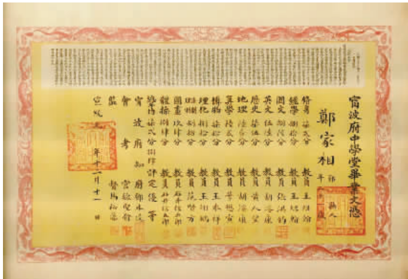
毕业证书(复制件)。