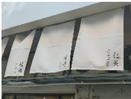
▲门头旗帜上写着宁波老话。