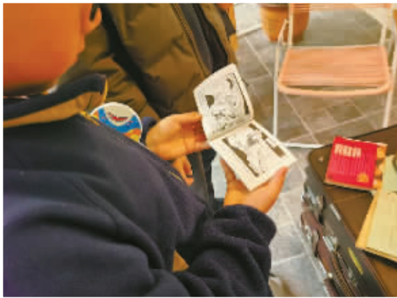
小朋友正在翻看连环画。