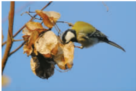
大山雀从黄山栎树的果实中觅食。