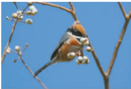
红头长尾山雀在吃乌桕种子。