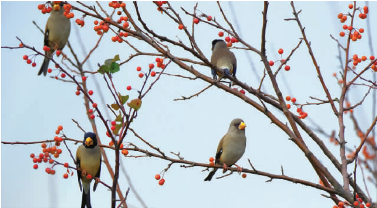
成群的黑尾蜡嘴雀在吃海棠的果实。