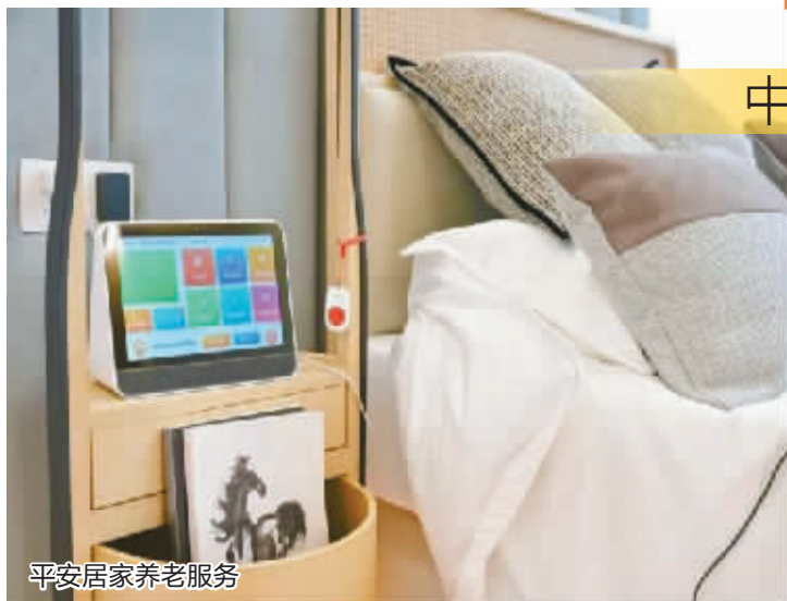
平安居家养老服务

由古及今,老有所养、老有所依、老有所乐、老有所安,一直是中国人的焦点。然而随着现代社会的发展,养老正变得越来越不容易。在全球人口老龄化的大背景之下,中国正面临着老年人口规模大,老龄化速度快,老龄化程度持续加剧,社会赡养压力大等严峻的挑战。如何有尊严、高质量地养老,已成越来越多人关注的话题。