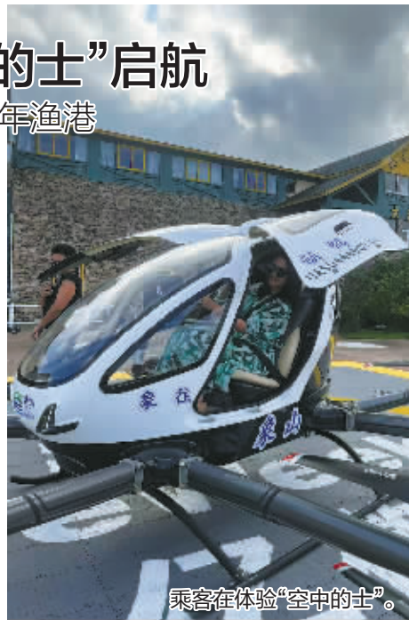
乘客在体验“空中的士”。

12月11日，象山旅游集团与厦门亿微客航空科技发展有限公司共同出资成立的象山县瞰海文旅发展有限公司正式注册，标志着象山“低空经济+文旅”融合迈出实质性一步。双方将在象山石浦的“中国渔村”区域引入电动垂直起降飞行器（eVTOL），打造创新低空旅游体验项目，为游客开启海、陆、空多维观光新时代。