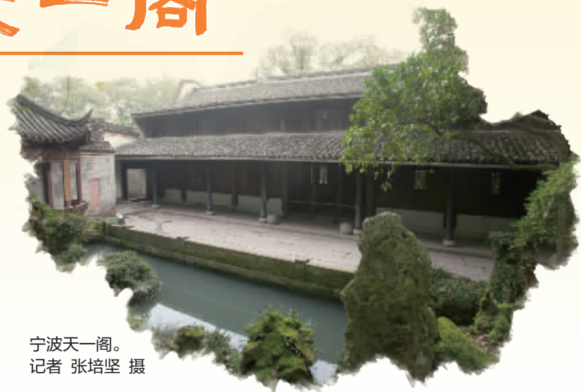
宁波天一阁。

这一带一般游客不多，却常有宁波客人着意寻访，只因这座紫禁城里最大的皇家藏书楼，系仿宁波天一阁而建。