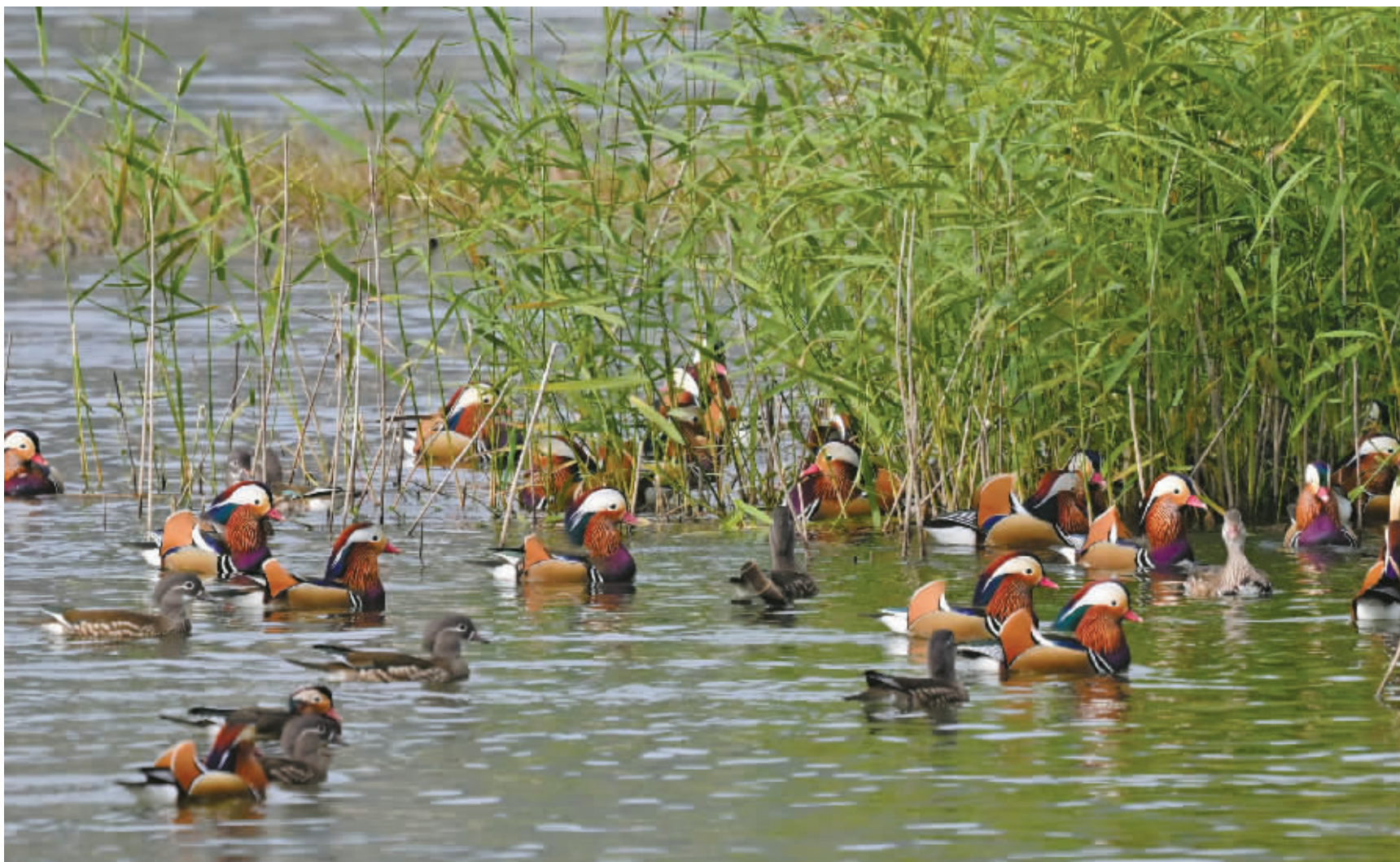
鸳鸯(近日摄于江北荪湖)。