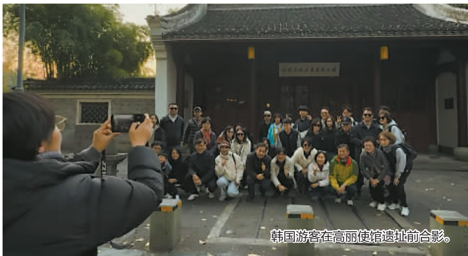
韩国游客在高丽使馆遗址前合影。

韩国游客来宁波，“第一站”会是哪里？12月6日下午，近200名韩国游客陆续抵达宁波。他们此行的首站选在了见证中韩千年友好交往的历史地标——高丽使馆遗址。