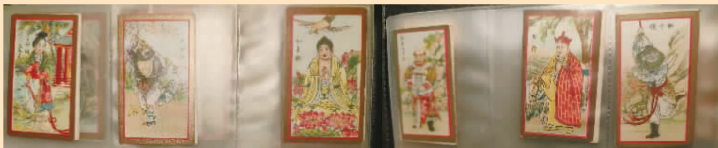
《西游记人物》烟画中的其他形象。