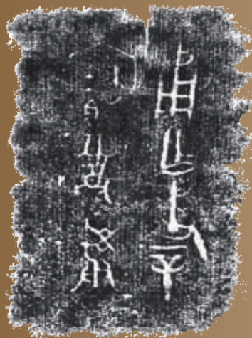
西周早期父辛鬲（甬作父辛宝尊彝）及铭文，郑州市博物馆藏。