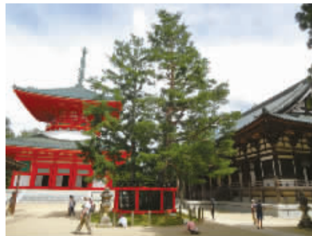
高野山上的“三钴之松”。（2015年8月7日）