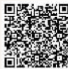
扫描二维码 可欣赏全文