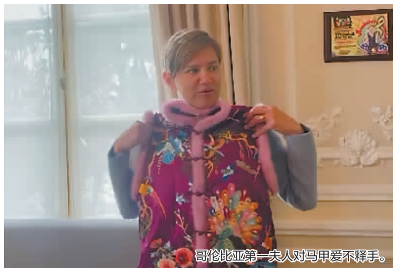
哥伦比亚第一夫人对马甲爱不释手。

近日,一则名为《宁波“针尖儿上的非遗美学”成国礼》的短视频在宁波文旅、宁波晚报、HiTangyuan等视频号平台上广泛传播。记者采访获悉,这是一款来自中国宁波的女式马甲,色彩绚丽、针法严密、绣工精巧,引起众多网友围观。