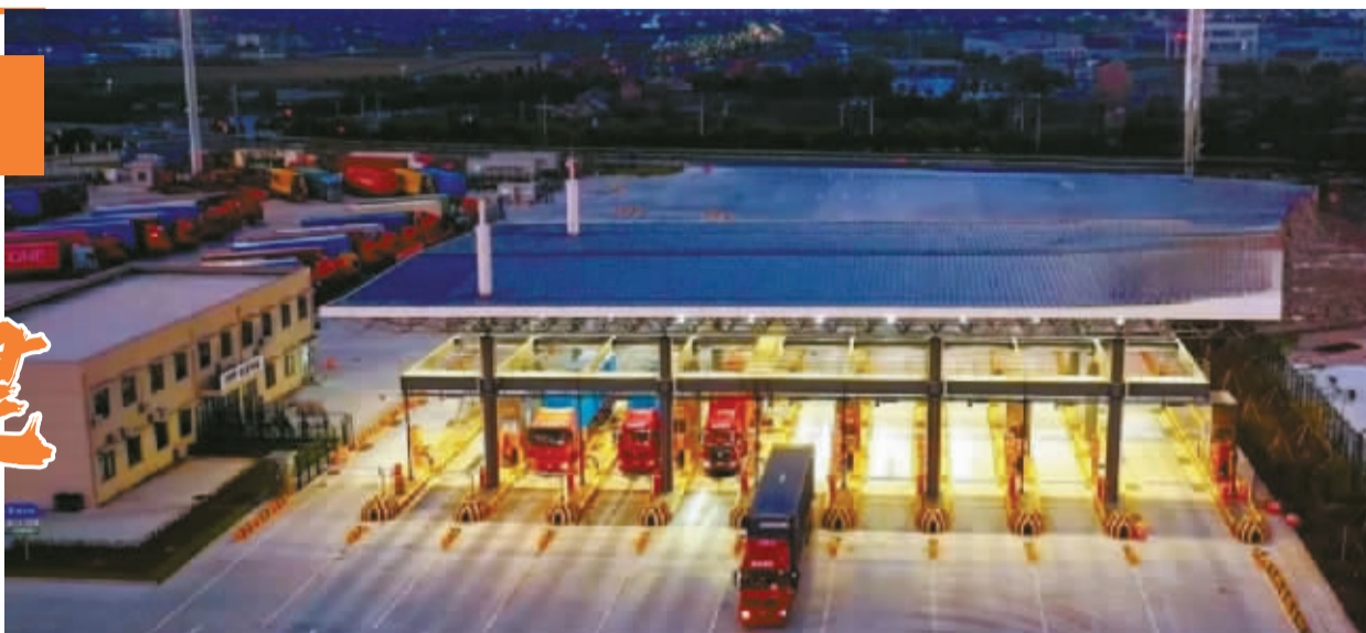
宁波舟山港智能闸口。