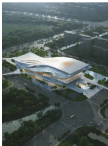
镇海区综合体育中心效果图。