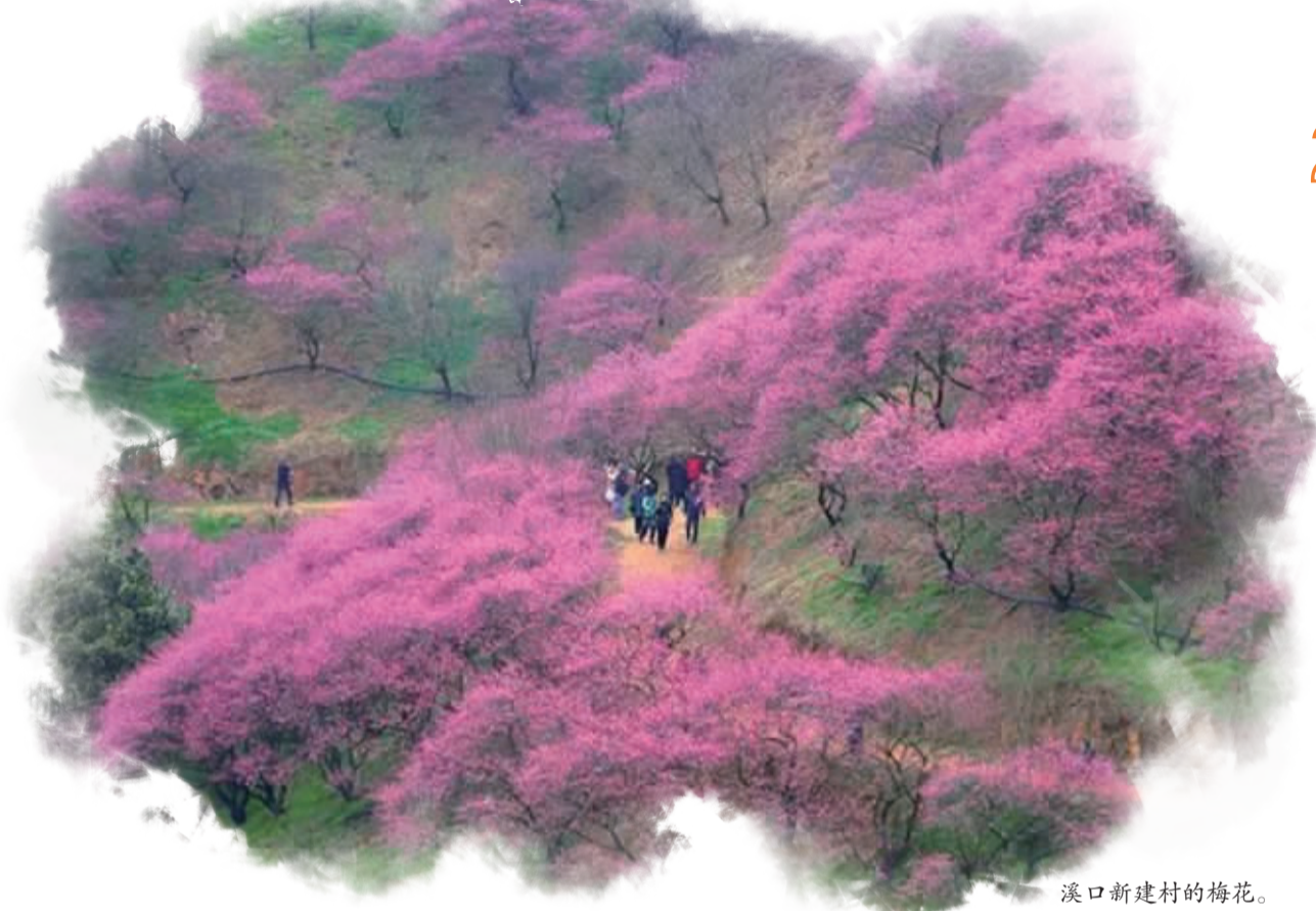
溪口新建村的梅花。 据溪口风景区官网