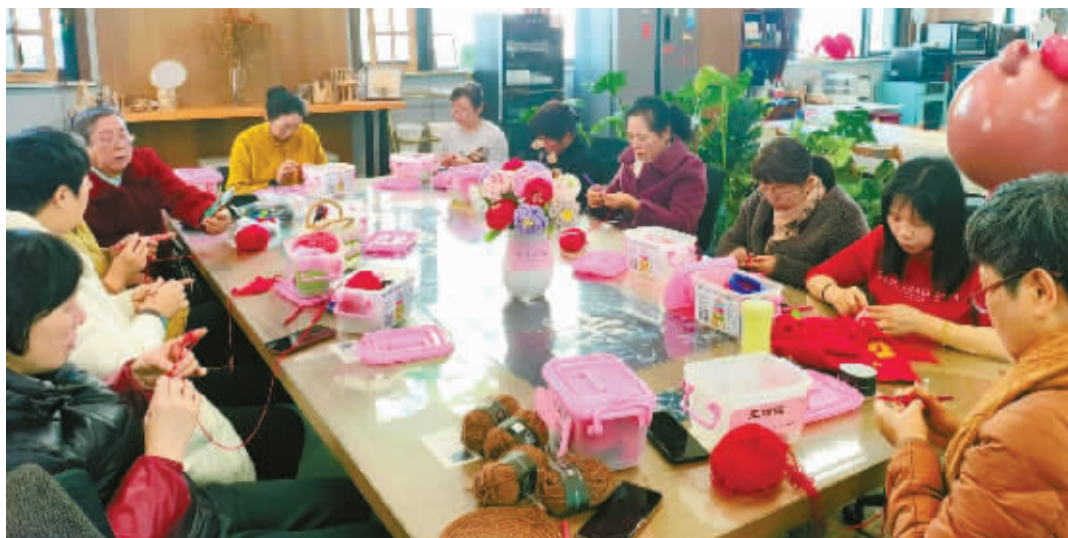
海创未来社区“有水平”编织社活动现场。