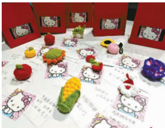
海创未来社区“有水平”编织社编织的解压盲盒展示。

当潮玩盲盒遇上传统编织，当闲置空间变身编织剧场，当编织技能化作邻里共享的纽带，银发巧手带来别样的治愈温情。在鄞州区下应街道海创未来社区，有个“有水平”编织社，一群平均年龄61岁的“编织达人”以毛线为媒，串联起社区互助共享的新网络。