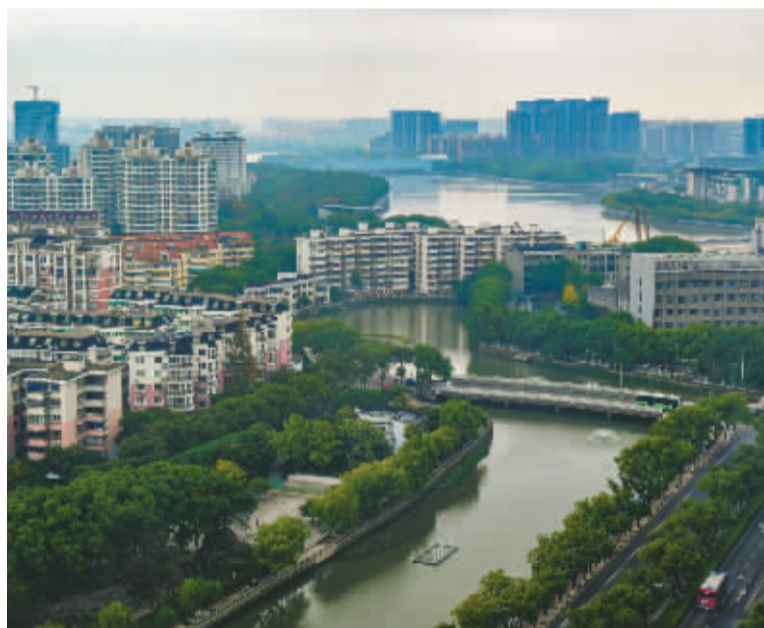
宁波市某小区(图文无涉)。