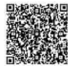
扫描二维码可欣赏全文