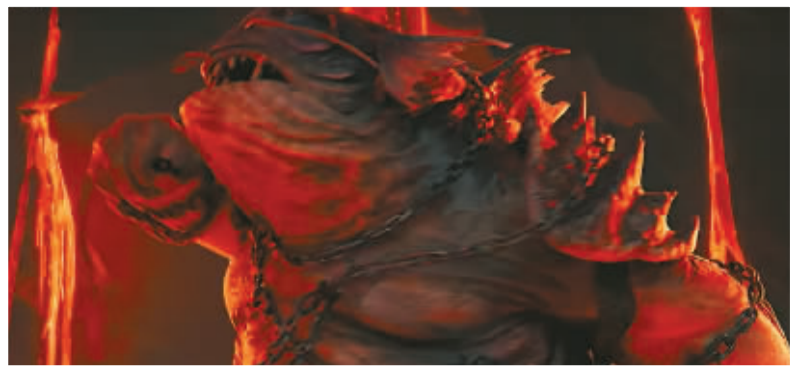
宁波点云文化有限责任公司制作的特效画面。