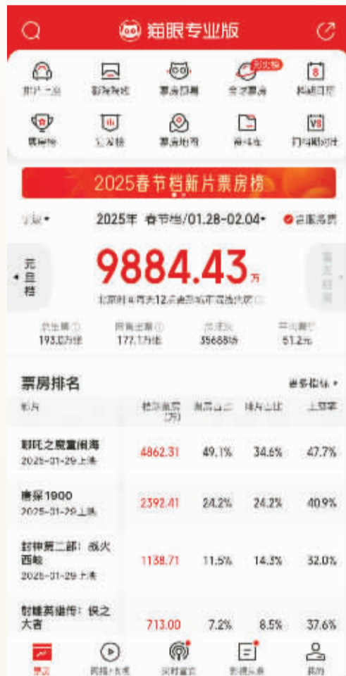
截至2月4日24点,猫眼专业版显示的宁波影院春节档票房。

春节期间,宁波各大影院人潮涌动,大厅等候区挤满了前来观影的市民,其中以家庭、亲子为主,放映厅几乎全满。