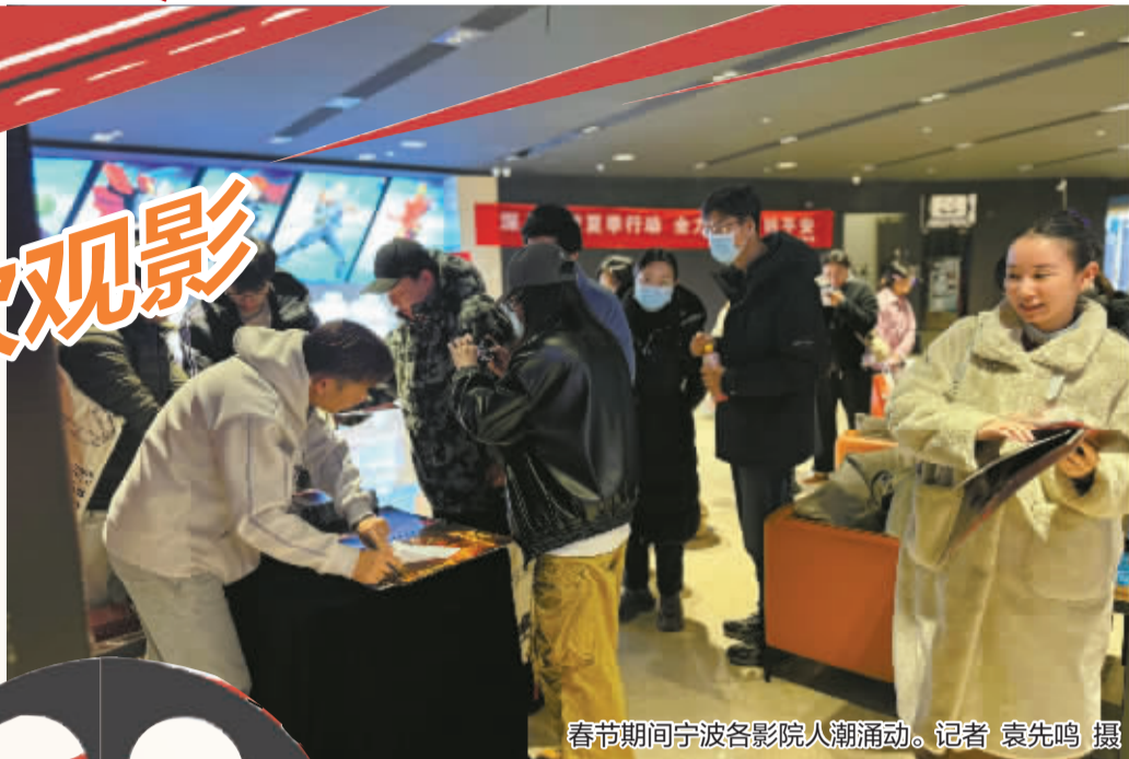
春节期间宁波各影院人潮涌动。记者 袁先鸣 摄

这个春节,电影市场持续火爆。售票平台“满座红”,现场购票“排长龙”,过年看电影成了“新年俗”。