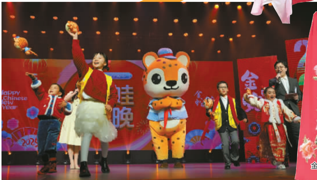
“金小豹”带着小记者和星萌宝贝送祝福。

幼儿园小朋友、小学生、初中生,演职人员近500人,1月22日,2025宁波市娃娃春晚在海曙区青少年宫进行了8小时联排。记者提前探班,看看这台汇集全市各区(县、市)优秀少儿节目的文化盛宴,有着怎样的风貌。