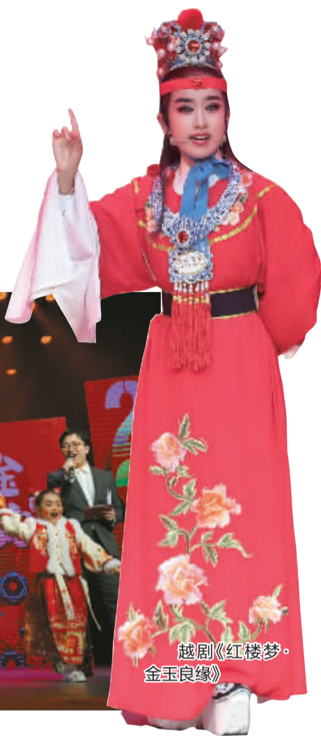
越剧《红楼梦·金玉良缘》