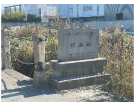
积湊碶现为海曙区文保点。

●嘉定十七年即公元1224年。“这说明积湊碶在南宋末年经过一次重修，头年正月初十开工，到第二年五月工程才结束，耗时一年又五个月。”研究者章国庆说。重修完工于1225年，距今正好800年。