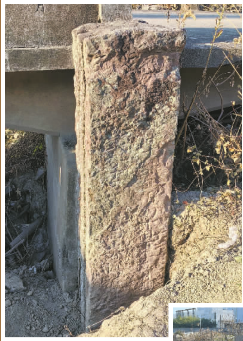
◀有南宋题刻的立柱。