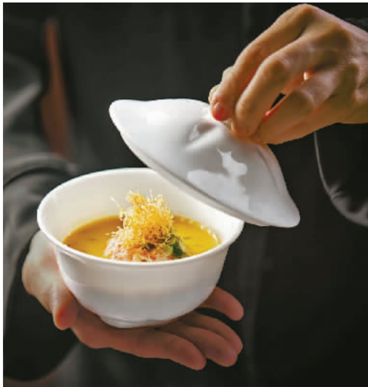
金华火腿黄鱼狮子头

其中,常州、泉州、温州、三亚首次开城,二线以下榜单城市持续壮大。宁波的黑珍珠“五虎将”依旧在列,甬城精致餐饮消费底气十足。