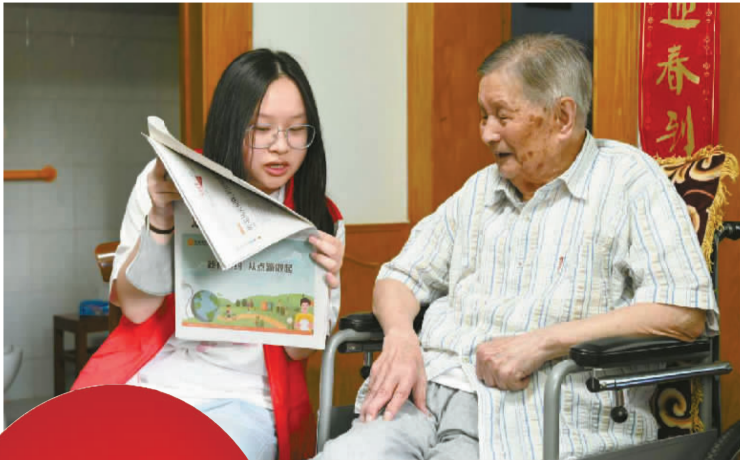
浙江工商职业技术学院学生上门为独居老人读报。