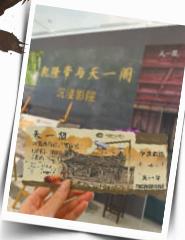
▲“乾隆帝与天一阁”沉浸式环景影院正在展出。

万件,品类众多,所藏古籍已达30万卷,其中珍本善本8万余册。在天一阁书库里,泛黄的古籍文物接受恒温恒湿装置的保护;在修复师的巧手下,破损的古籍以每年13000页的速度修复;编纂出版的《天一阁藏古籍善本目录》《天一阁藏历代方志汇刊》等千余册古籍整理及研究成果,以及“云上天一阁”的数字技术,正让深藏古阁的故纸以新形态焕发新生机。