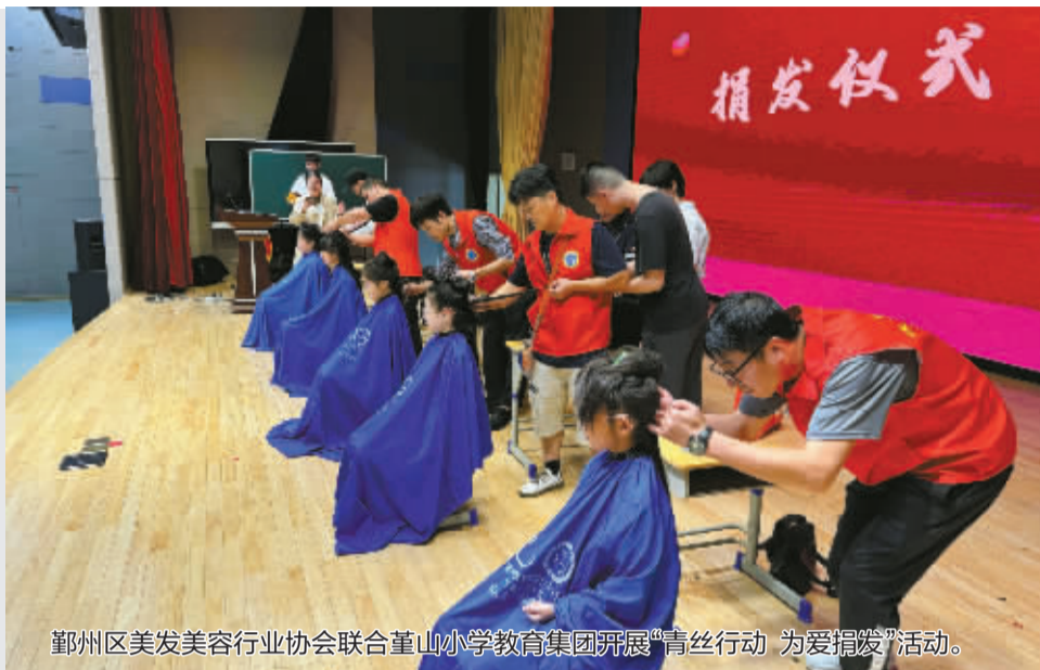
鄞州区美发美容行业协会联合董山小学教育集团开展“青丝行动 为爱捐发”活动。