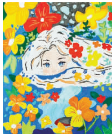
花中美少女 海曙外国语学校青林湾校区402班 宋语歌(证号2460407)

听到柳老师喊我们，大家都拿着自己挑选的物品开心地跑着回到教室。这个淘宝节真是意义非凡啊！