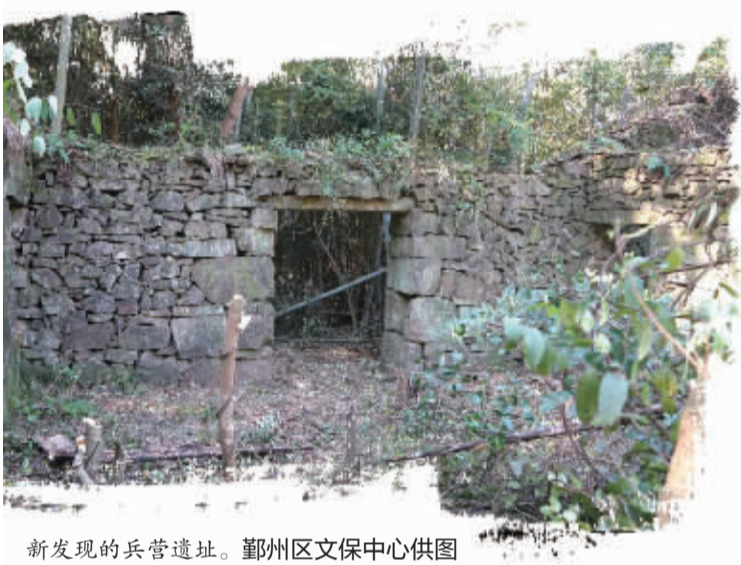
新发现的兵营遗址。

据光绪《鄞县志》记载,1861年太平天国“来王”陆顺德率部攻打奉化时,曾经在亭溪岭一带和官军进行过战斗。此次发现的营寨,或为当年战火遗痕。