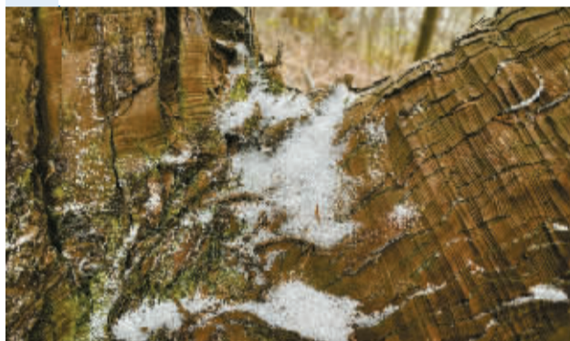
昨天,黄泥浆岗落了一点雪子。