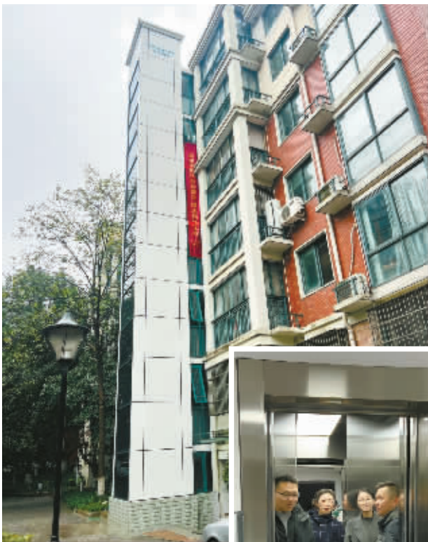
清泉花园小区居民自发举行仪式,庆祝加装电梯投入使用。