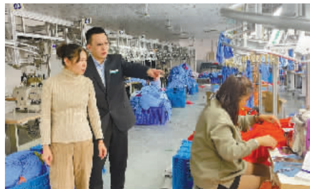
农行宁波高新区分行客户经理走访服饰加工小微企业，了解企业生产经营情况和金融需求。