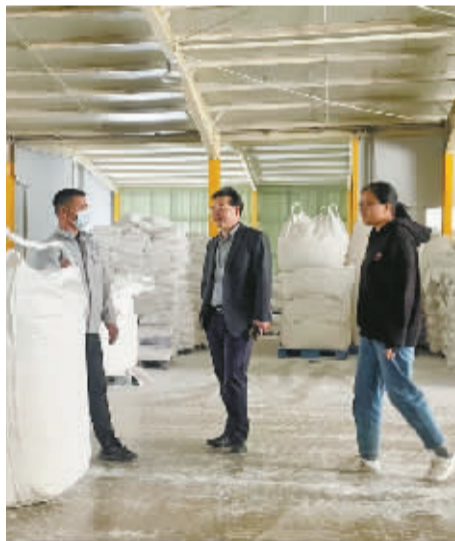
农行宁波市分行积极开展“千企万户大走访”活动。