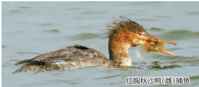
红胸秋沙鴨(雌)捕鱼

今年宁波入冬特别早,11月27日就进入了气象意义上的冬季,比常年早了一周。目前,来宁波越冬的冬候鸟已基本到齐,因此又到了一年观鸟的最好季节了。作为海滨地区,水鸟显然是宁波鸟类的一大特色。不过,对于很多初学观鸟的人来说,在野外想准确辨识种类繁多的水鸟,是相当不容易的。这里,我为大家分享一个观鸟小窍门,即“看嘴识鸟儿”!