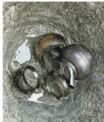
▲陈王遗址良渚文化时期灰坑。

2017年后，宁波市文化遗产管理研究院(原宁波市文物考古研究所)在奉化江流域开展了大量考古