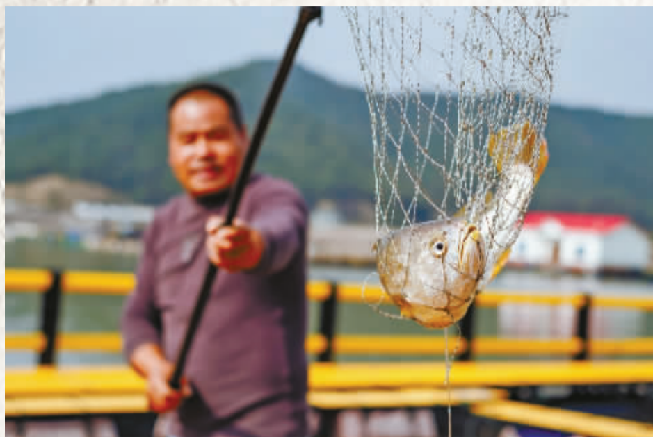
捞起大黄鱼的一瞬间。

他们中有资深媒体人，擅长挖掘独家故事；还有全网粉丝数十万的自媒体达人；也有多种职业身份的“斜杠青年”。不管是哪一种，他们都有一股“如此热爱宁波”的赤诚，用心传递文明宁波的信念。