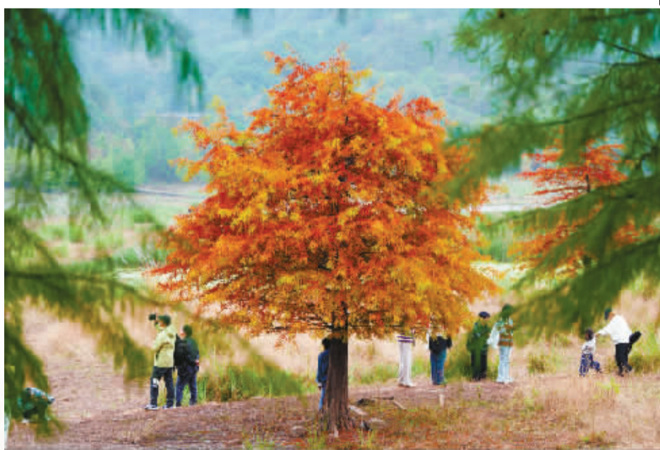
亭下湖池杉树。

这段时间，宁波四明山等地开始进入一年中最美的季节。“在宁波，看见文明中国”拍客团走进余姚市四明山镇北溪村、奉化区溪口镇岙底村亭下湖等地开展采风拍摄活动，记录风景里的文明。