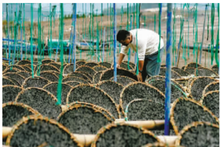
村民晒制紫菜。魏轶民 摄