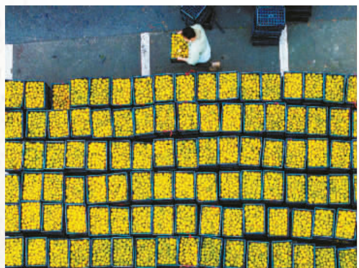
溪里方村中，村民橘子大丰收。

象山县黄避岙高泥村在2019年获得“全国文明村”荣誉，该村也是“浙江省黄鱼养殖第一村”，登船离岸，拍客们立马被一条条大黄鱼吸引。