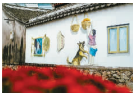
溪里方村墙上作画。