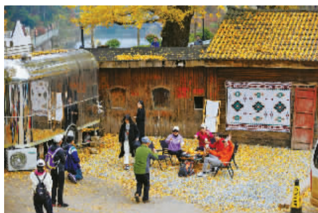
游客们正在村中拍摄，文明有序。