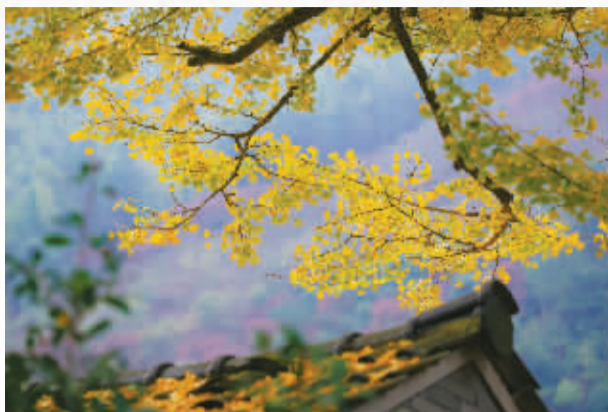
北溪村银杏。

在象山县墙头镇的溪里方村，沿途走来，家家户户都晾晒着家家家训。村新时代文明实践站内还设有德治馆，展陈了溪里方村从明代到近代30余位先贤的事迹，以及该村的德治成果，这里不仅成为全村的道德窗口，更让拍客在潜移默化中领略道德魅力。