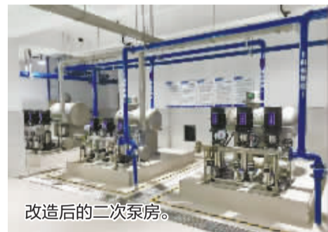
改造后的二次泵房。

纳入此次改造范围的天怡湾北区、澜璟园和澜臻园3个小区目前已正式开工。接下来,市水务环境集团将全力推